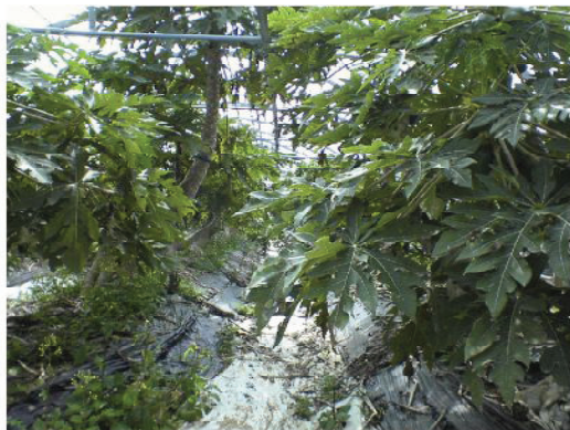
施工から3年経過の状況