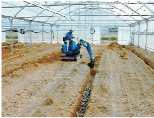
暗渠排水施工状況