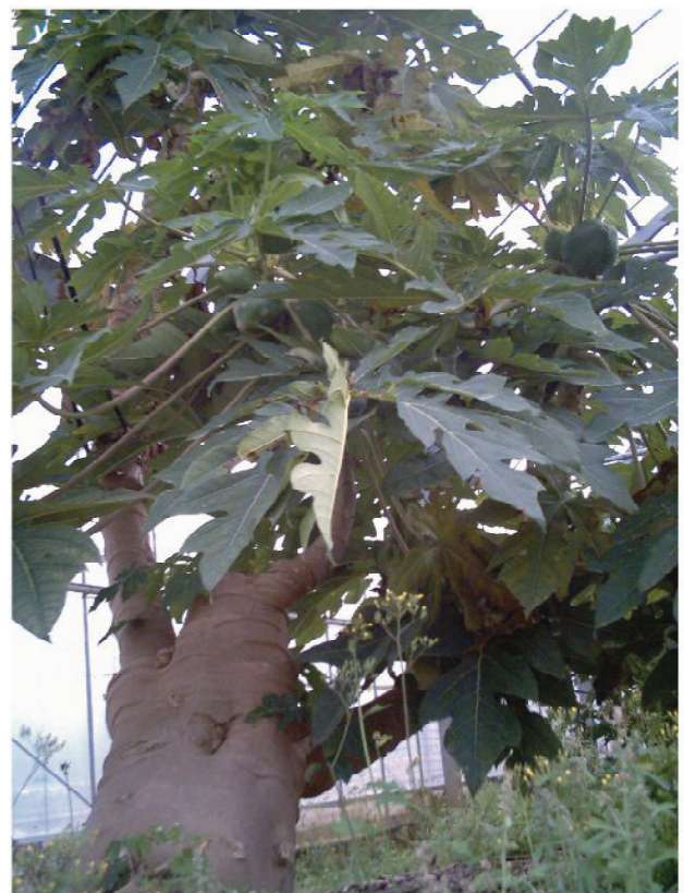
通常よりとても太いパパイヤの状況