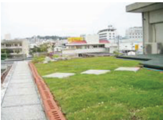
▲サンガードの上に芝張り