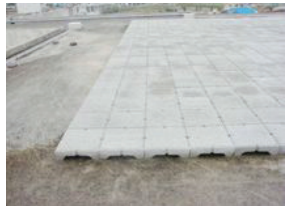
▲スーパーソルサンガードを敷設